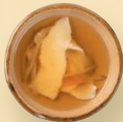
お子様用ひつつみつき